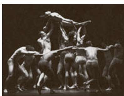
Das Ballett in Aktion.

Das Genfer Ballett tanzte an diesem Abend vom Himmel durch die Welt zur Hölle – und wenn die Hölle mit „Le Sacre“ das Ende darstellte, so war zuvor die Choreographie „Selon désir“ von